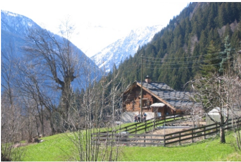
Chalet "Ranfji" Sommer