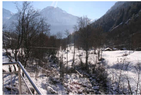
Winterblick von der oberen Terrasse