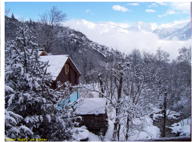
Chalet "Ranfji" im Winter